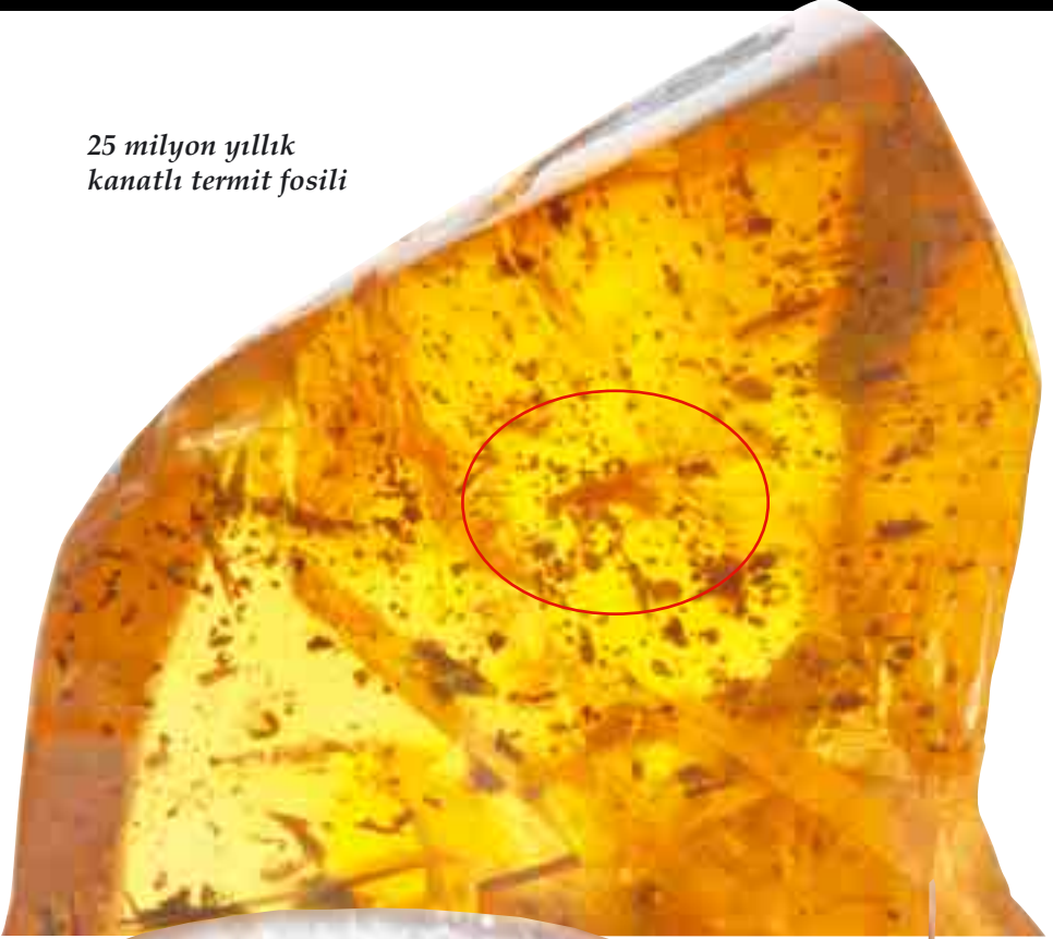
25 milyon yıllık kanatlı termit fosili