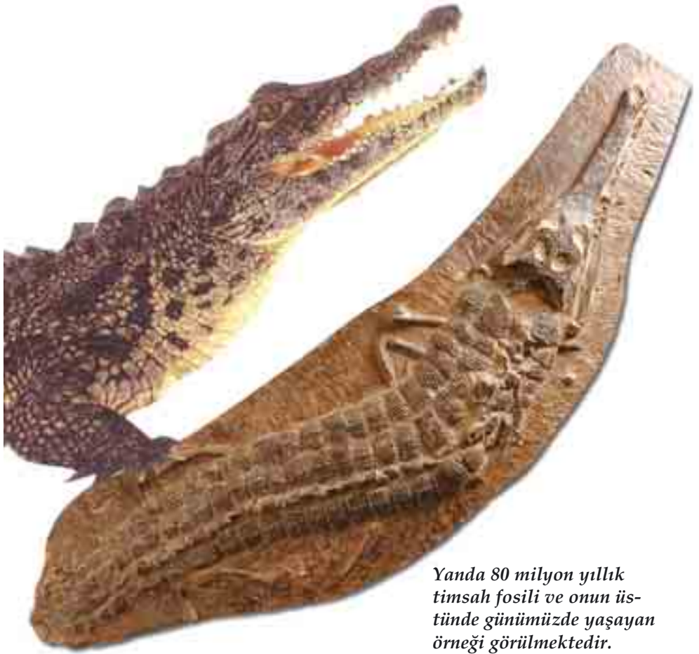
Yanda 80 milyon yıllık timsah fosili ve onun üstünde günümüzde yaşayan örneği görülmektedir.

Tüm fosil örnekleri yüz milyonlarca yıl önce yaşamış canlılarla bugünkü örnekleri arasında hiçbir fark olmadığını gösterir. En eski jeolojik dönemlerde yaşayan canlılar dahi hiç değişiklik geçirmeden günümüze kadar gelmişlerdir. Fosiller göstermektedir ki, canlılar tarihin hiçbir döneminde ilkelden gelişmişe doğru bir süreç yaşamamışlardır. Tam aksine bugünkü aynı kompleks yapı ve özellikleriyle yeryüzünde bir anda ortaya çıkmışlardır.