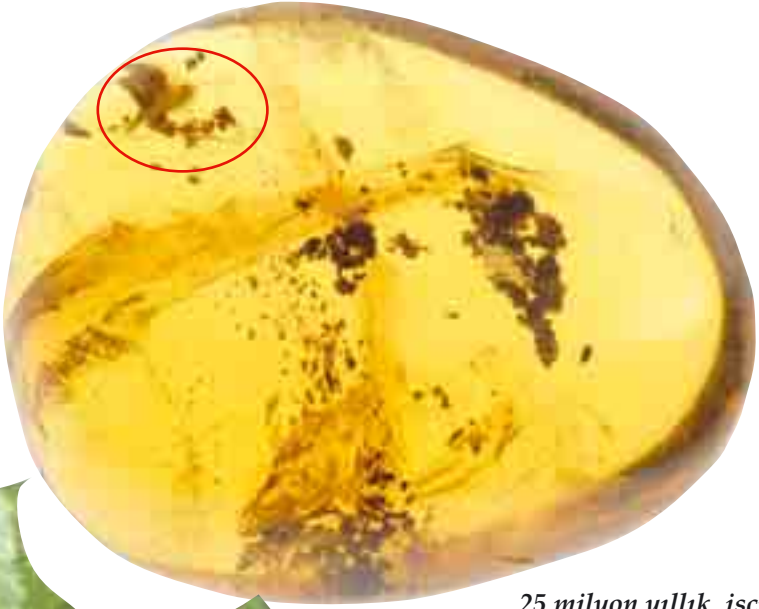
25 milyon yıllık işçi karınca fosili