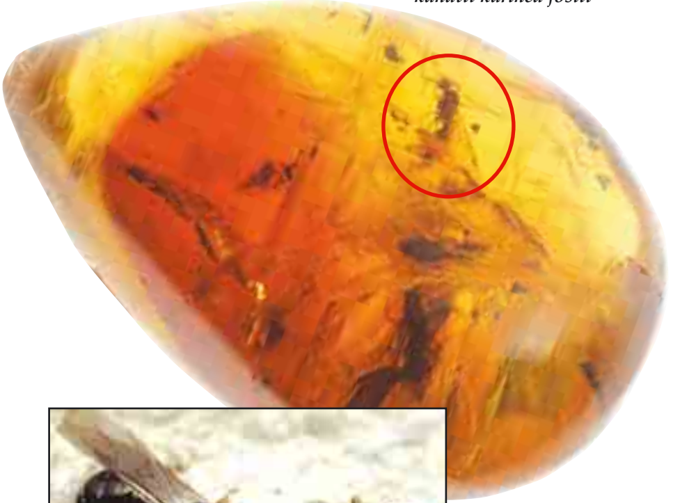
25 milyon yıllık kanatlı karınca fosili