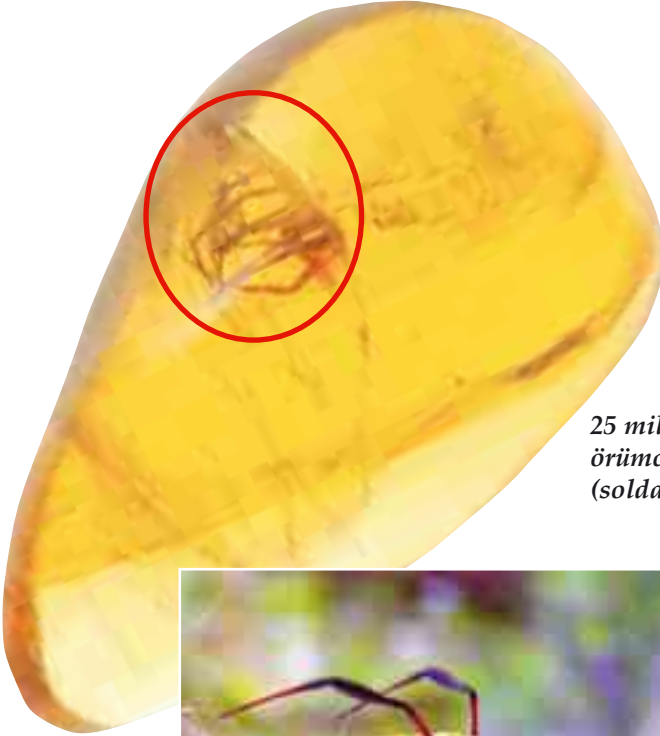
25 milyon yıllık örümcek fosili (solda)